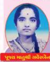
પૂજ્ય માતુશી અપેરબેન